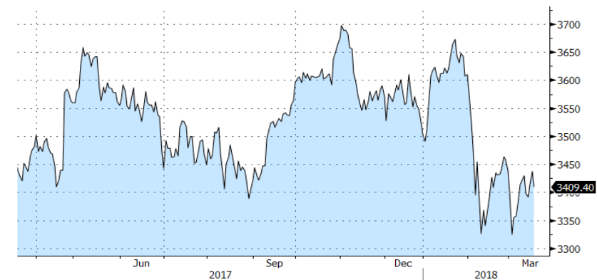
EURO STOXX 50 - 1 Y

En el ámbito político, Estados Unidos y especialmente Trump están siendo el foco de atención por dos motivos: el recrudecimiento de la guerra comercial con la imposición de aranceles por parte de Estados Unidos y por el caos existente en la Casa Blanca. Esta semana conocimos la destitución del Consejero de Seguridad Nacional, mientras que el nuevo asesor económico de Trump, abogaba por una política de dólar fuerte, mayores recortes fiscales y seguir con la línea dura en las relaciones comerciales con China.